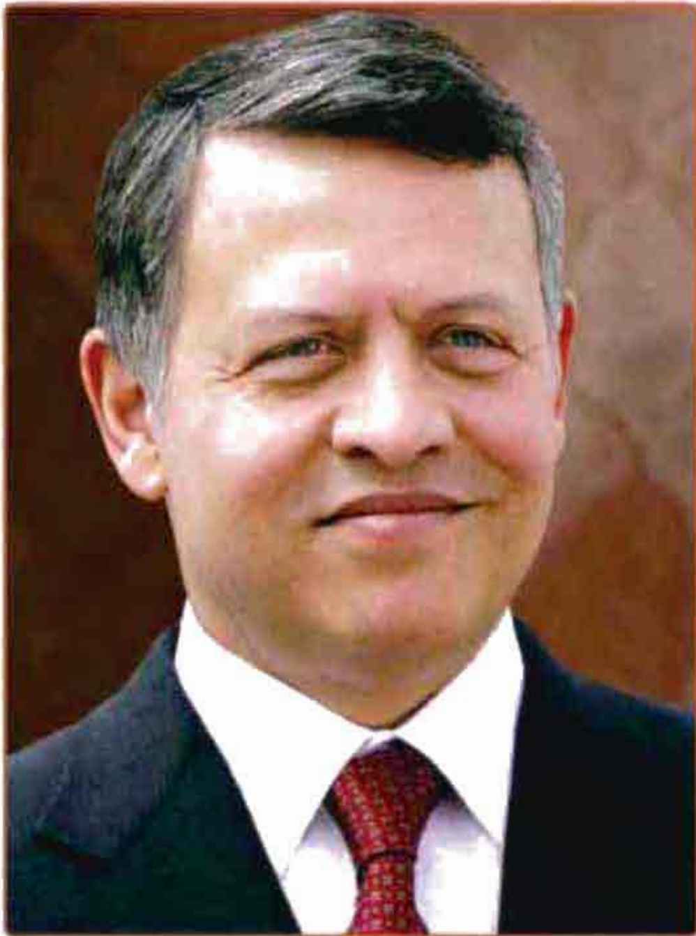
صاحب العلاء الملك عبد الله الثاني بن الحسين المعظم