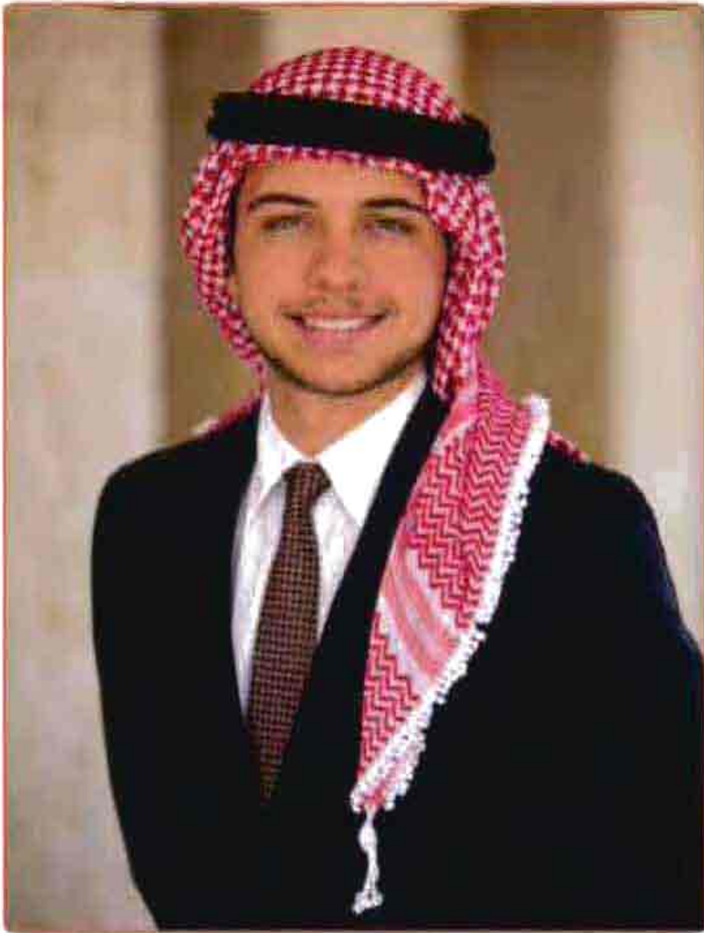
ولي العهد صاحب السمو الملكي الأمير الحسين بن عبد الله الثاني بن الحسين المعظم